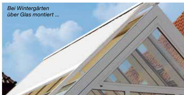
Bei Wintergärten über Glas montiert ...