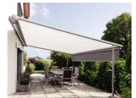
PERGOLA-MARKISEN vereinen Komfort und Sicherheit durch bequeme Bedienbarkeit und hohe Wetterbeständigkeit.