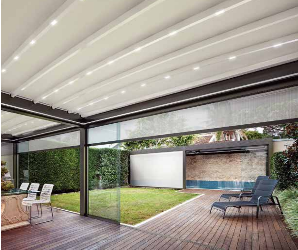
Faltdach MED Azimut mit leicht gebogenen Dachprofilen und LEDs