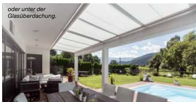
oder unter der Glasüberdachung.