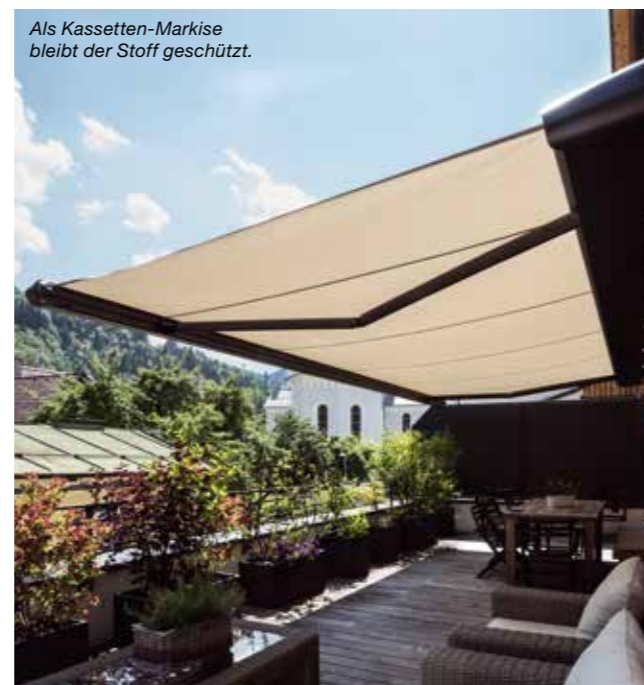
Als Kassetten-Markise bleibt der Stoff geschützt.