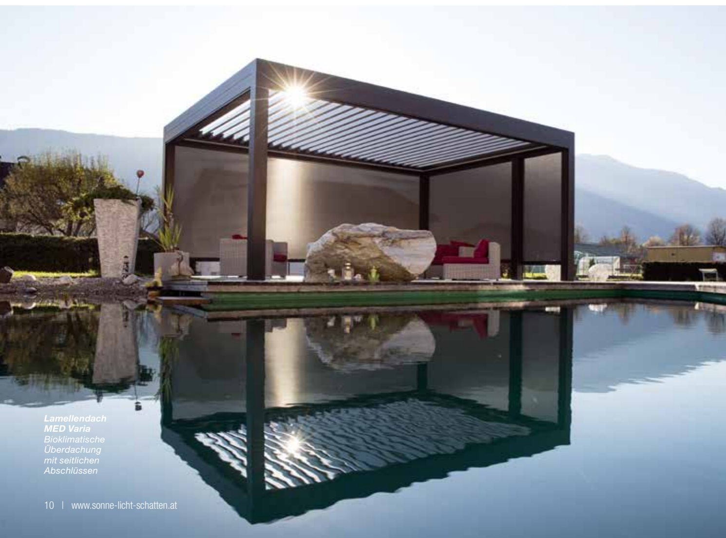
Lamellendach MED Varia Bioklimatische Überdachung mit seitlichen Abschlüssen

Flexibler Wetterschutz mit stabilem Komfort